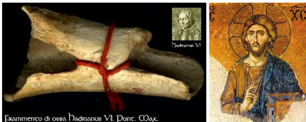
(a) Relikwie van paus Adriaan VI

De persoon wordt beheerd door de blikken die anderen op hem werpen. En dat is waarom die religieuze intuïtie dat de persoon niet sterft met zijn lichaam me goed te verdedigen lijkt—iemand's persoon overleeft zijn lichaam, maar niet in een of andere hemel; hij leeft voort in de anderen.