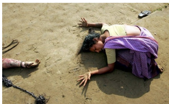
(b) “Woman mourns relative killed in tsunami, Cuddalore, India, Tamil Nadu, 28 December 2004”, Arko Datta