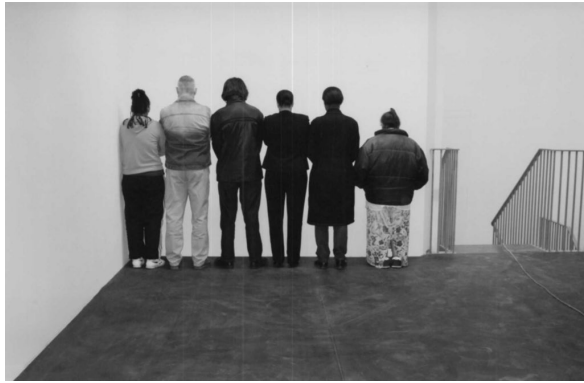
(a) Group of Persons Facing the Wall