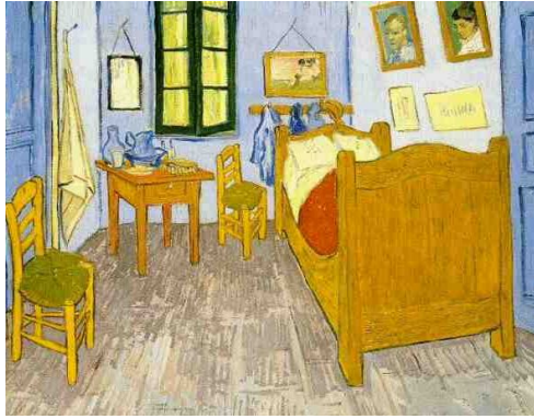
(a) Het schilderij (...)