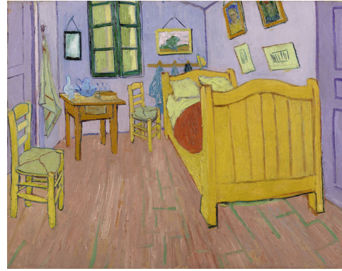
(b) Kleurenimpressie van de originele kleuren van De slaapkamer zoals ze mogelijk zijn geweest toen Van Gogh het schilderij maakte.