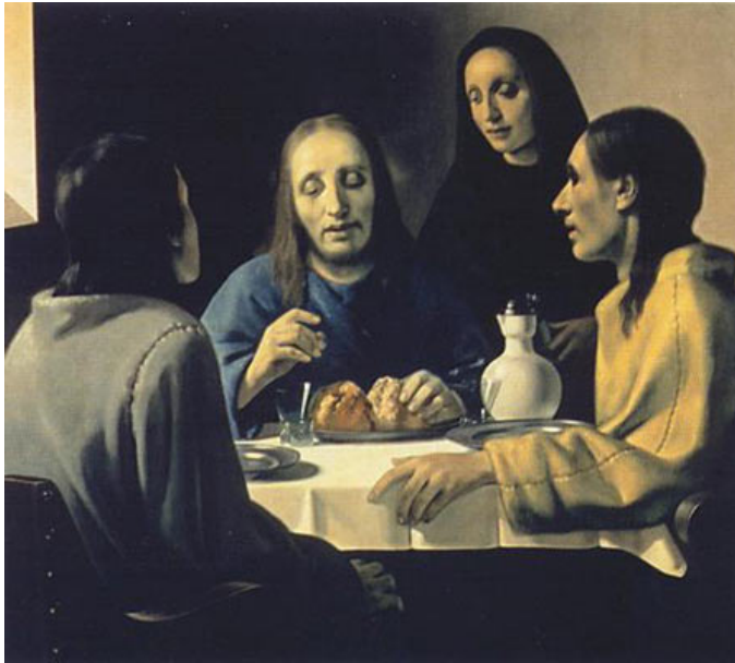
Figuur 1: Van Meegeren: “De Emmausgangers”