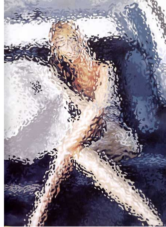
(b) Plug Ins