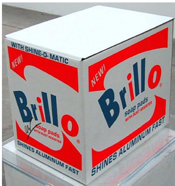
(a) Andy Warhol: “Brillo Boxes”