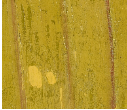
(a) Detail van voeteind, voor restauratie