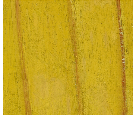
(b) Detail van voeteind, na restauratie