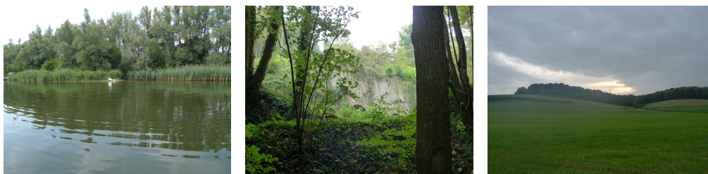
Figuur 1: Natuurschoonheid

als ik ze wat genaderd ben, volstrekt alcoholistisch blijken te zijn: ze zijn omringd door bierblikjes, ze gedragen zich ietwat dreigend, praten en gebaren te expliciet, komen me te na, ze stinken ook. Ze leken mooi, maar zijn het niet—kunnen we dat zo zeggen?