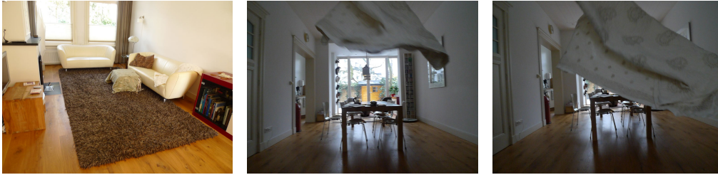
Figuur 2: Inrichting van huis