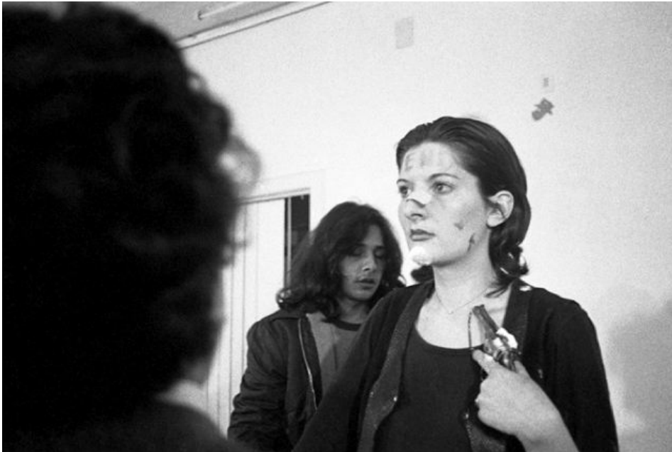
Figuur 3: Marina Abramovic: Rhythm 0

Het gaat hier sowieso niet louter om het verleggen van een grens—of beter: het onderwerp is niet wat er door de grens (die eerst hier en na het werk daar ligt) buitengesloten wordt, maar het proces van het ervaren van die grens.