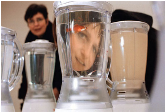
a. "Helena" — ( Goudvissen in mixer ), 2003, Trapholt Art Museum, Kolding, Danmark