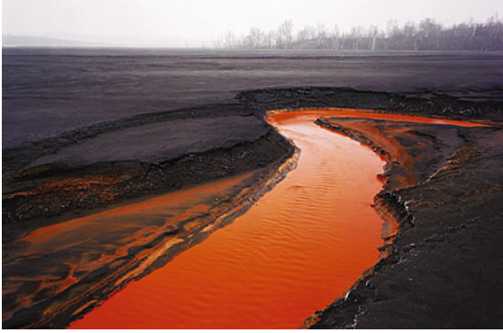
a. Edward Burtynsky, "Nickel Tailings"