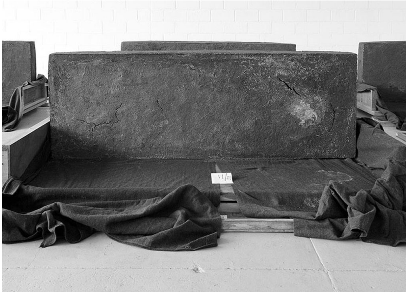
Figuur 10: Santiago Sierra: “21 anthropomorphic modules”, 2005