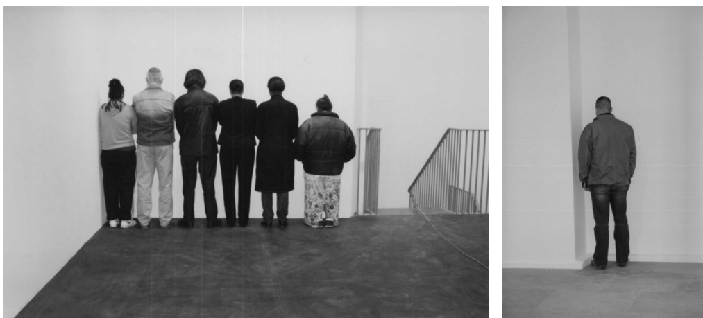
Figuur 9: Santiago Sierra: “Group of Persons Facing the Wall and Person Facing Into a Corner”, 2002