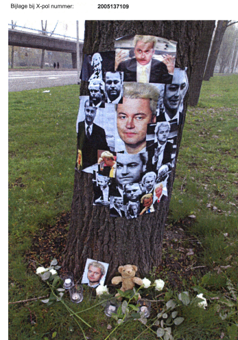
b. Jonas Staal, "De Geert Wilders Werken", 2005