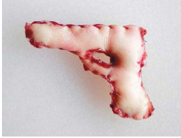
Figuur 6: Joanneke Meester: “Huidpistooltje”, 2004: sculptuur? ...