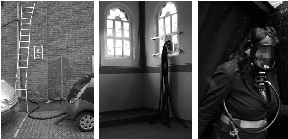
Figuur 11: Santiago Sierra: “245 Cubic Metres”, 2006