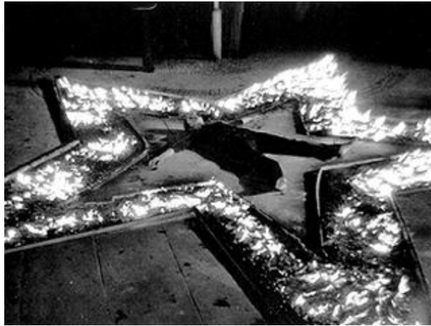
(a) Marina Abramovic: "Rhythm 5"