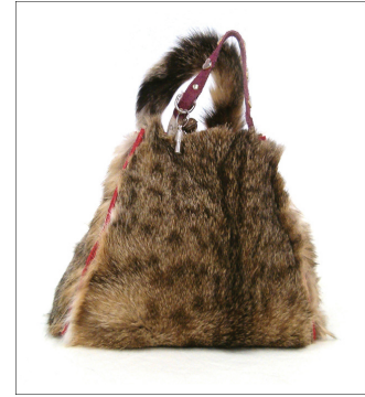
(c) Tinkebell: "My Dearest Cat Pinkeltje"