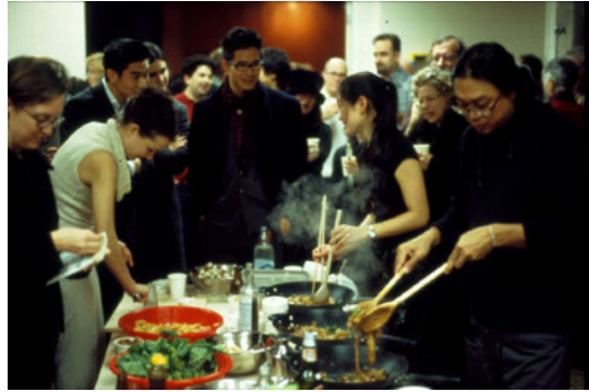
(b) Rirkrit Tiravanija: "Cooking for people"