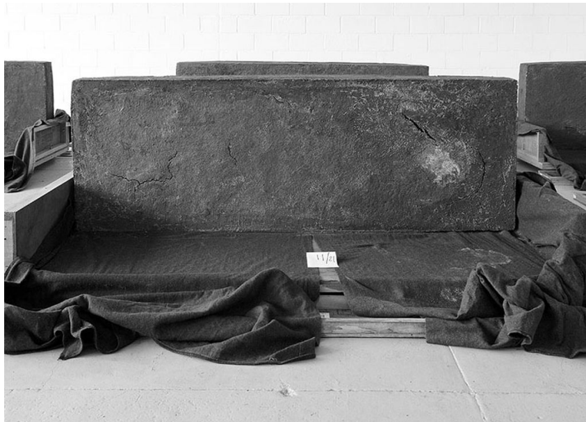
Figuur 9: Santiago Sierra: “21 anthropomorphic modules”, 2005