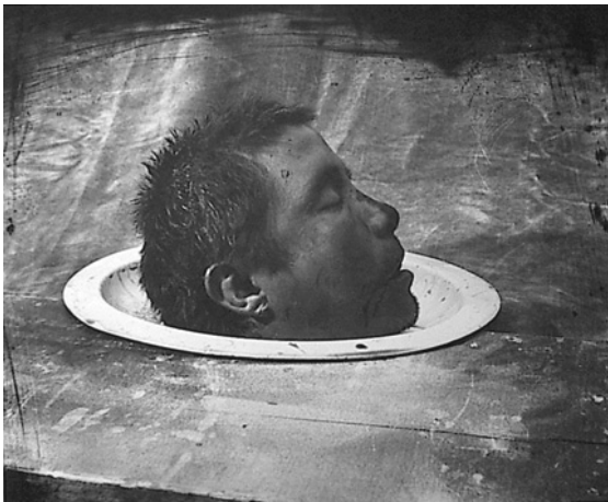
(a) "Hoofd van een Dode Man", Mexico 1990