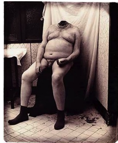
(b) "Man Zonder Hoofd", 1993