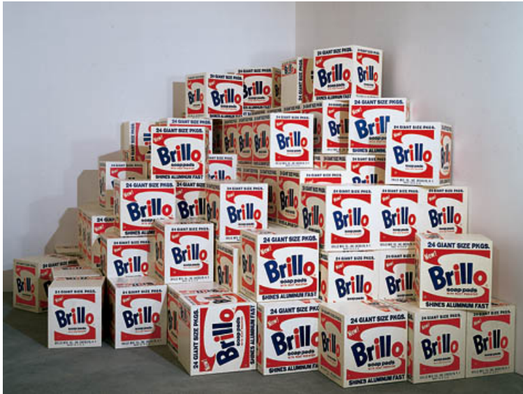
Figure 2: Mike Bidlo: “Bidlo, not Warhol”