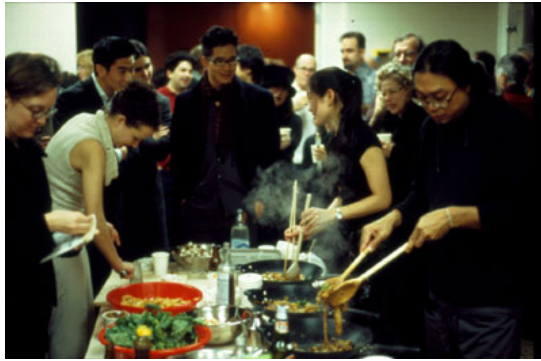
(b) Rirkrit Tiravanija: "Koken voor mensen"