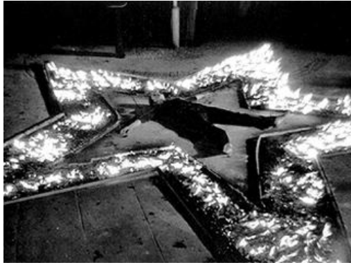
(a) Marina Abramowicz: "Rhythm 5"