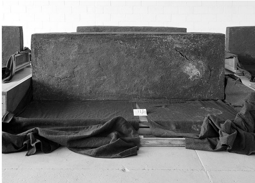
Figure 9: Santiago Sierra: “21 anthropomorphic modules”, 2005