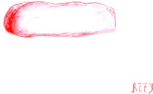
(b) Thierry de Cordier: Bull