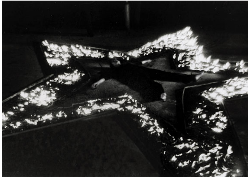
Figuur 2: Abramowicz Rhythm 5 (zie noot 4 op pagina 11)

Eerst representeren we en dan zijn we eventueel redelijk. Praten, ons denken, de moraal, de media, de kunst: het zijn allemaal praktijken van mensen die ons vermogen tot representeren veronderstellen.