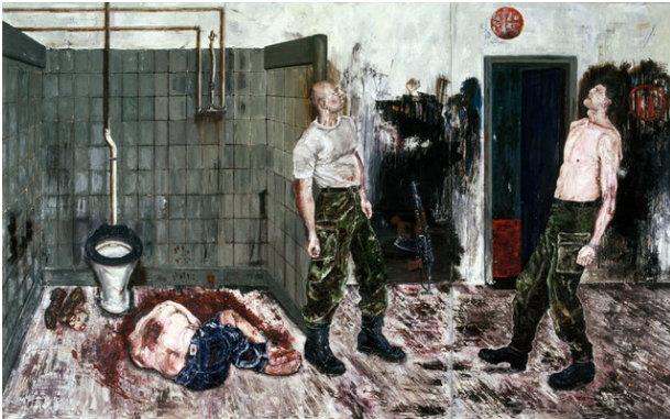
(a) Ronald Ophuis, "Executie", 1995