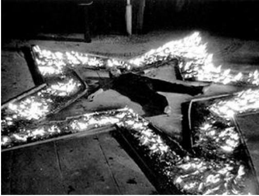
(a) Marina Abramowicz: "Rhythm 5"