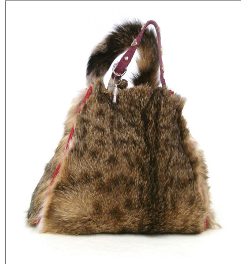
(b) Tinkebell: "My Dearest Cat Pinkeltje"