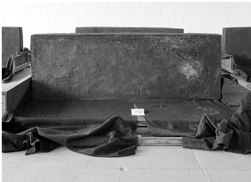
Figuur 9: Santiago Sierra: “21 anthropomorphic modules”, 2005