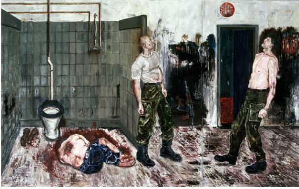
(a) Ronald Ophuis, "Execution", 1995