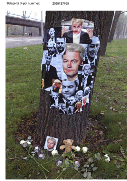
(b) Jonas Staal, "De Geert Wilders Werken", 2005 (kunst?)