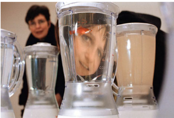
(a) 'Helena', 2003, Trapholt Art Museum, Kolding, Danmark