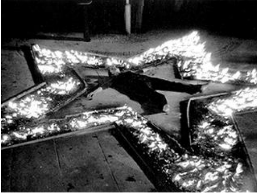
(a) Marina Abramowicz: "Rhythm 5"