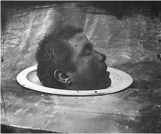
(a) "Head of a Dead Man", Mexico 1990