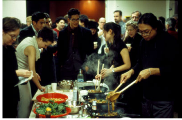
(b) Rirkrit Tiravanija: "Koken voor mensen"