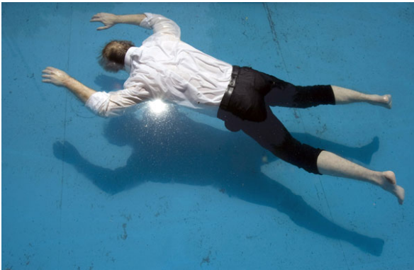
(a) Elmgreen and Dragset: "Death of a Collector" (Bienale Venice, 2009)