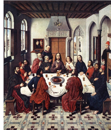
(b) Dirk Bouts: Het laatste Avondmaal