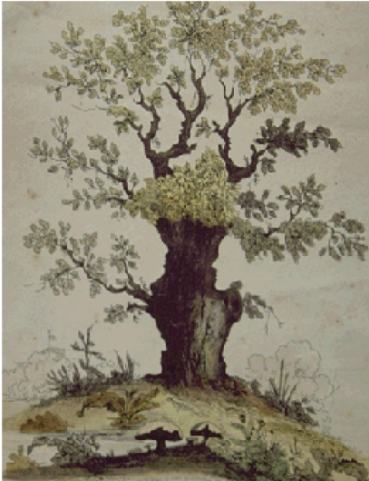
(a) Gepast wijzen (deelbare ervaring)