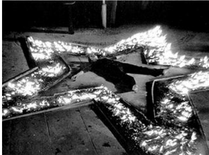
(b) Marina Abramowicz: "Rhythm 5"