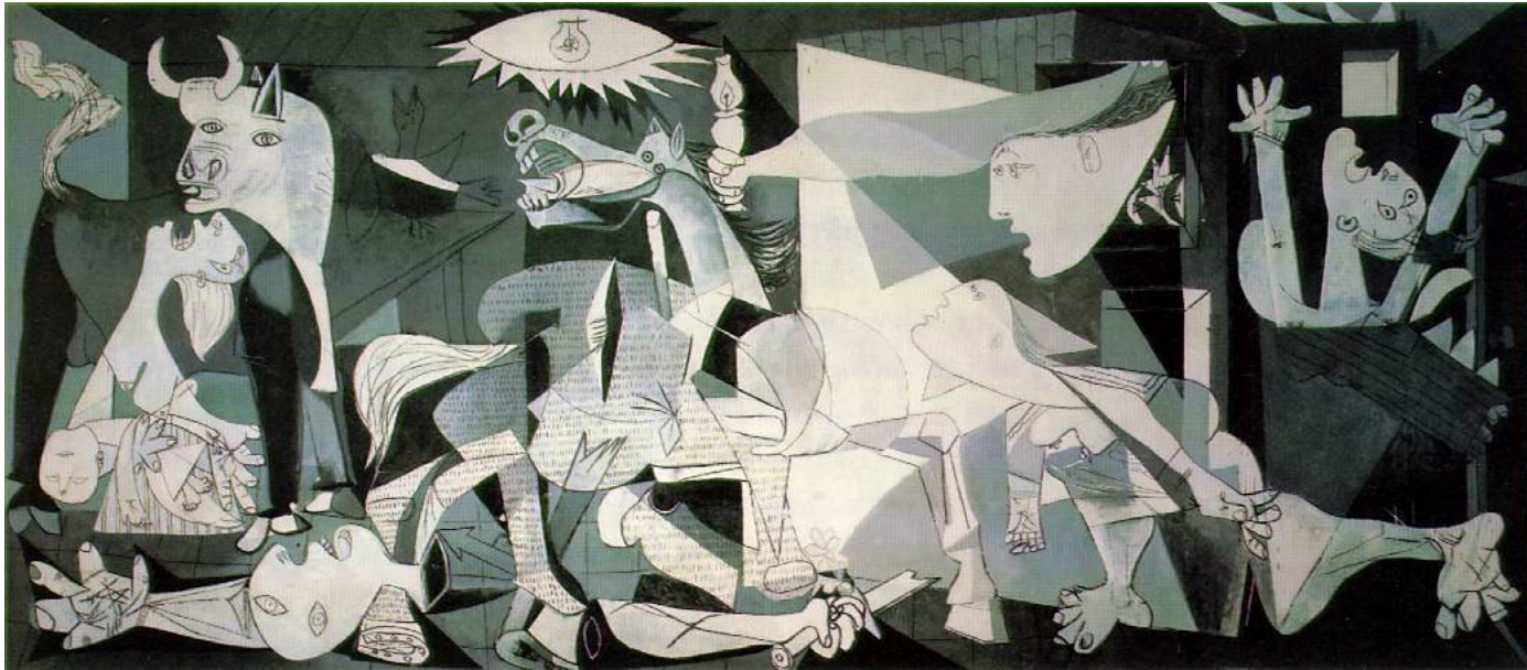
Figuur 1: Subjectieve eigenschappen