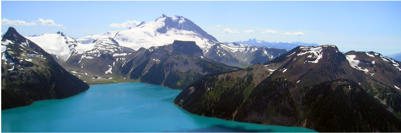
Figuur 2: Mooi panorama